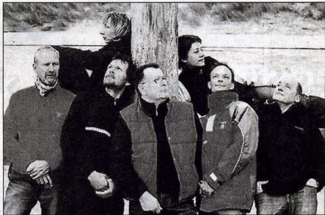
Die Marler Band „Löwenherz“ tritt am Samstag in der Aula der Eckerland-Schule auf.

Das erste Konzert des Jahres ist für die Band der Start in die Konzertsaison. Auf den nächsten Auftritt werden die Freunde von Löwenherz allerdings bis Juli warten müssen. Erst dann wird das neue Programm bühnenreif sein. Auch die Musiker des dann neunköpfigen Rockorchesters sollen dann eingearbeitet sein.