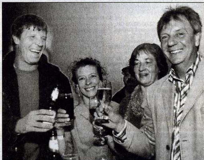
Gute Stimmung herrschte beim Konzert von Löwenherz in der Aula der Günther-Eckerland-Realschule.